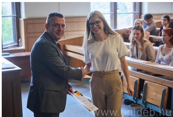
2024. június 10. a TDK-zó nyelvészhallgatók hazai szakmai konferencián (Anyanyelvünk évszázadai 10.) történő részvétele